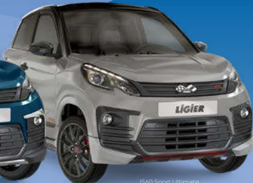
JS60 Sport Ultimate