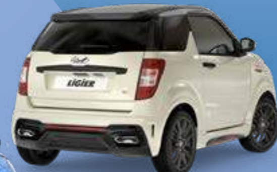
JS50 Sport Ultimate