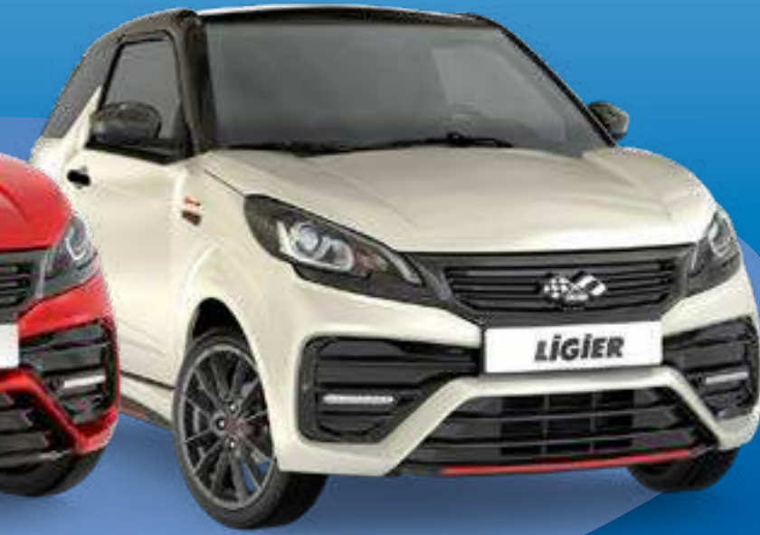
JS50 Sport Ultimate