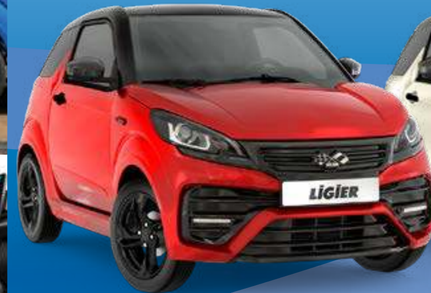
JS50 Sport Pack