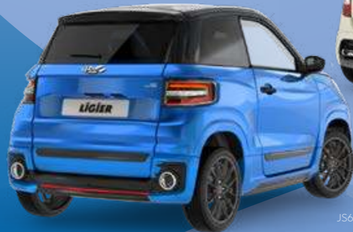
JS60 Sport Ultimate

DE SPORTIEVE STADSAUTO OPNIEUW UITGEVONDEN